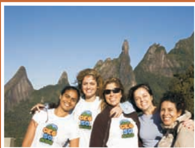
Torres de Bonsucesso