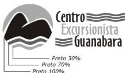
versão monocromática P&B